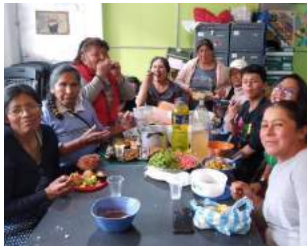
Gemeinsames Mittagessen, zu dem jede etwas mitbringt