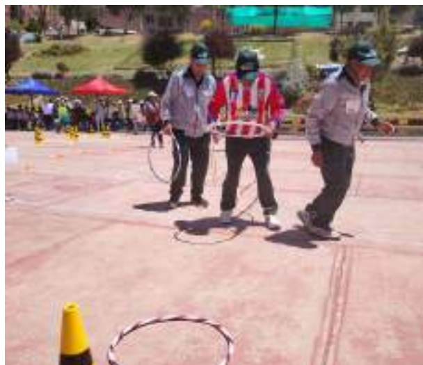
Teilnehmende bei den Seniorenolympiaden „Jóvenes del ayer“