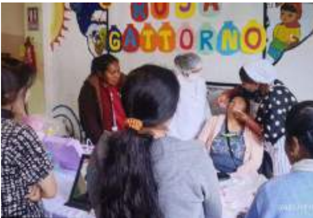
Workshop zur Selbstfürsorge am Tag der bolivianischen Frau.