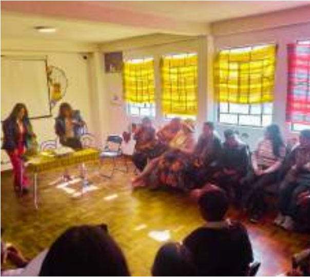
Teilnehmerinnen beim Workshop zum Gesetz 348 gegen Gewalt an Frauen