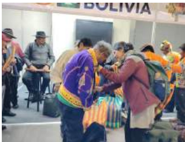
Vorbereitungen für die Teilnahme an der Buchmesse auf dem Messegelände Chuquiago Marka

6 Institutionen nahmen teil – insgesamt 145 ältere Menschen.