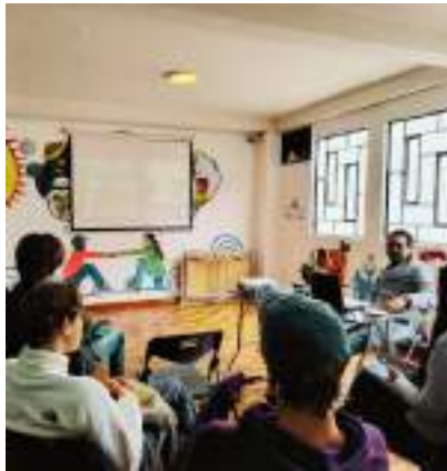
Fortbildung zum Einsatz der KI