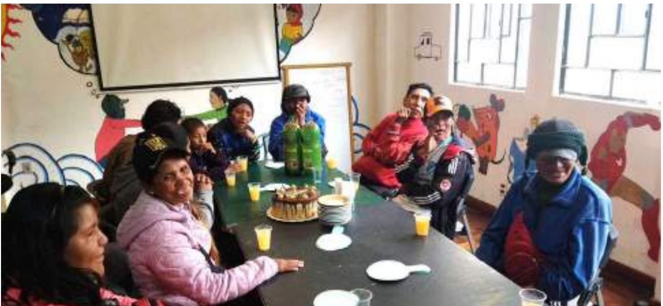
Teilnehmende bei einer gemeinsamen Geburtstagsfeier