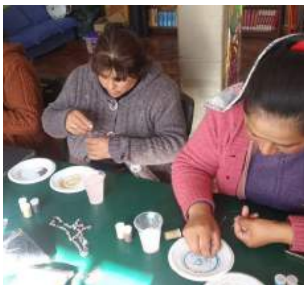
Teilnehmerinnen beim Workshop zur Schmuckherstellung

Teilnahme an verschiedenen Märkten und Veranstaltungen zum Verkauf der Handarbeiten