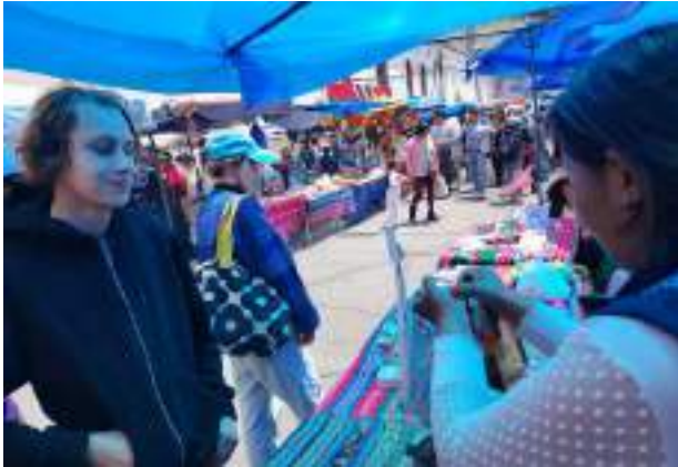
Teamausflug zu den Alasitas