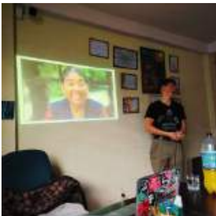
Fortbildung zj Schneiden von Videos