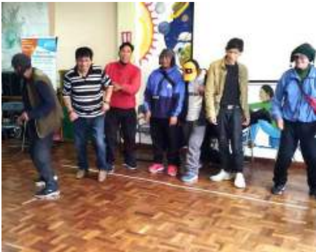
Teilnehmende bei einer Gruppenaktivität