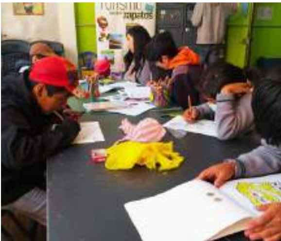
Workshop für Grundschul Kinder