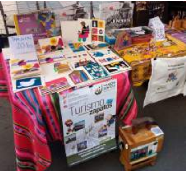
Ausstellung der handgefertigten Karten auf einer Projektmesse der Stadtverwaltung von La Paz