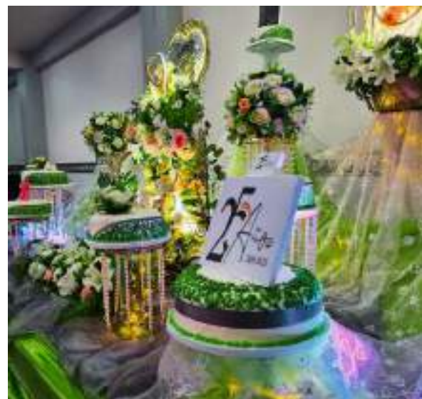
Geburtstagsorte - 25 Jahre VAMOS JUNTOS