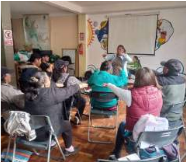
Teilnehmende beim Rhetorik-Workshop

51 Personen nahmen 2025 an den Stadttouren teil.