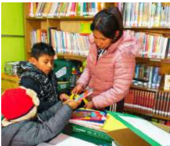
Ausgabe der Schulmaterialien