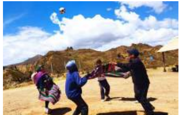
Teilnehmende bei Koordinationsübungen