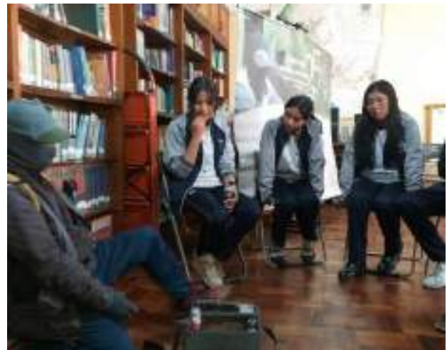
Schüler*innen des Colegio Ave María beim Workshop

Das Projekt wurde außerdem in Radio- und Fernsehsendungen vorgestellt.