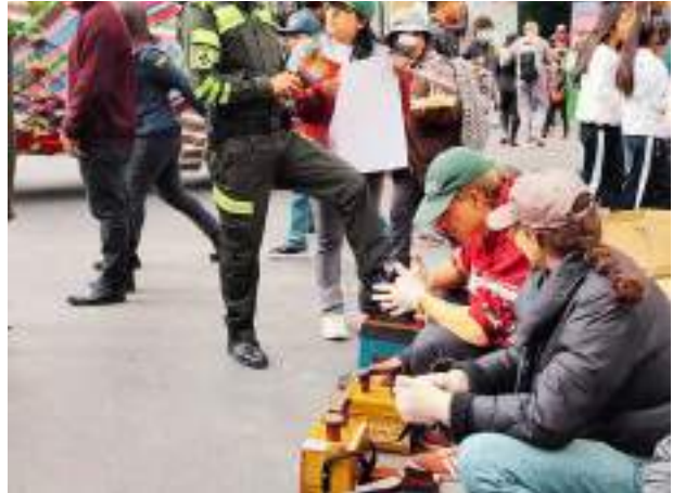
Teilnahme am "Desfile Paceño" zum Stadtjubiläum von La Paz