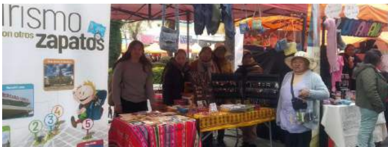
Teilnehmerinnen beim Sonntagsmarkt zur Präsentation von Projekten, organisiert von der Stadtverwaltung

Teilnahme an verschiedenen Märkten und Veranstaltungen zum Verkauf der Handarbeiten