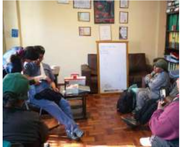
Teilnehmende des Projekts beim Erste-Hilfe-Workshop

In diesem Projekt arbeiten 6 Schuhputzer*innen (4 Frauen, 2 Männer) zwischen 45 und 67 Jahren als Referent*innen.