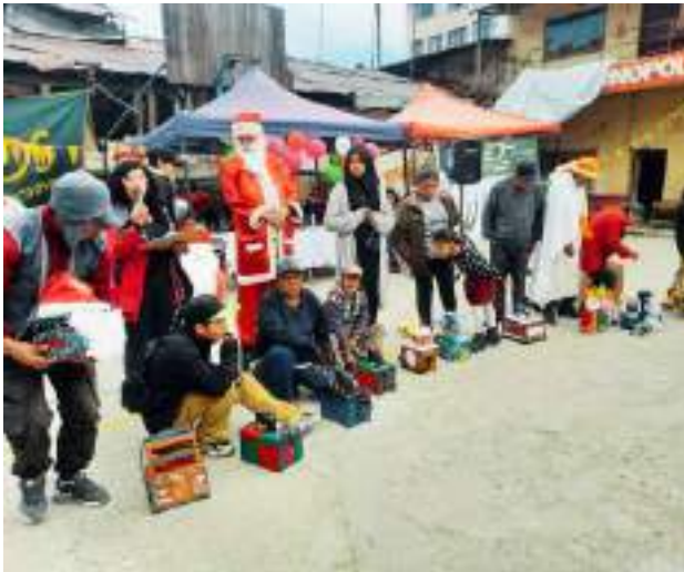
Weihnachtsaktivität – Wettbewerb der dekorierten Schuhputzkästen