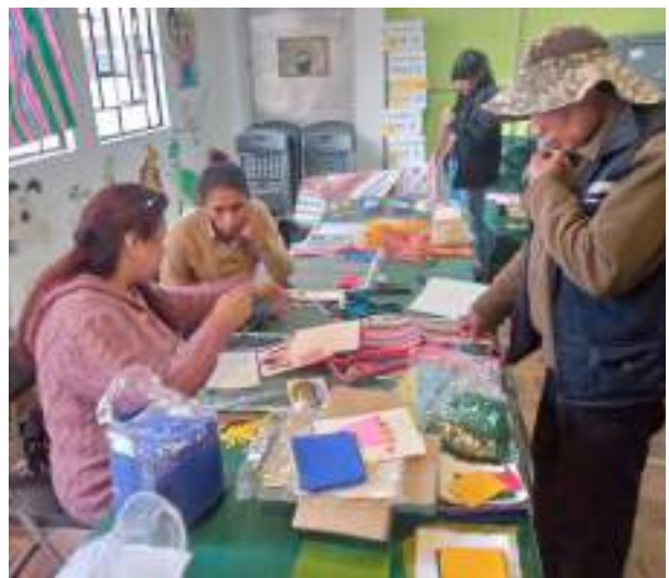
Teilnehmerinnen bei der Herstellung handgefertigter Karten