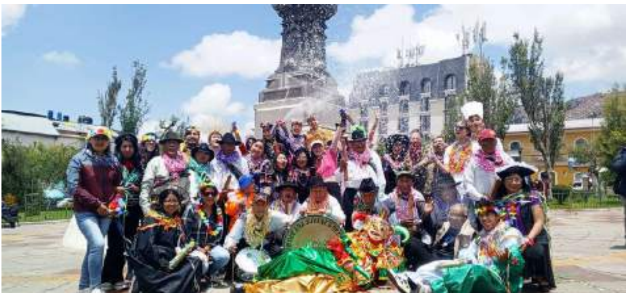
Feien zu Karneval