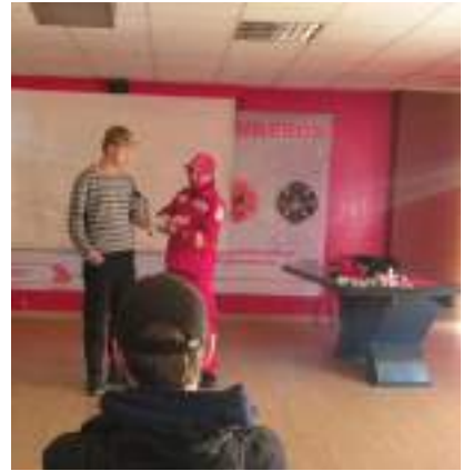
Erste-Hilfe-Kurs mit der Feuerwehr