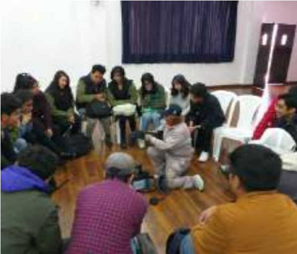
Virginia gibt einen Workshop für Studierende