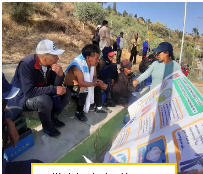
Workshop im Anschluss ans Fußballspiel zum Thema Übergewicht

Am Turniertag selbst kamen auch zum Anfeuern viele Schuhputzer*innen und Familienmitglieder dazu; es war ein wunderbarer Tag bei schönstem Wetter, an dem der Sport, der Fair-Play-Gedanke und die gemeinsame Zeit im Vordergrund standen.