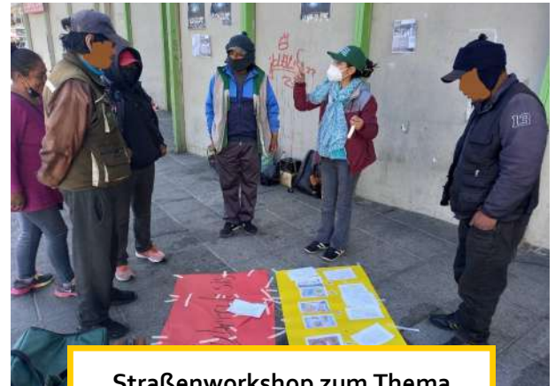
Straßenworkshop zum Thema Tuberkulose

Wichtig sind diese persönlichen Gespräche am Arbeitsplatz für alle Schuhputzer*innen und insbesondere für diejenigen, die alkoholabhängig sind. Im September konnte auch die aufsuchende Straßenarbeit mit der „Gruppe Hoffnung“ wieder aufgenommen werden. Seitdem haben wir neun Straßen-