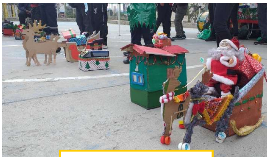
Weihnachtlich geschmückte Schuhputzkästen

Anschließend wurden die schönsten weihnachtlich geschmückten Schuhputzkästen ausgezeichnet. Wir waren sehr beeindruckt von der Kreativität der Teilnehmenden! Mit einer Tanzeinlage bedankte sich das VAMOS JUNTOS Team bei allen Schuhputzer*innen und Familienmitgliedern