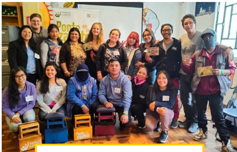
„Begib Dich in meine Schuhe“ - zusammen mit anderen Süd-Nord-Freiwilligen

„Zuallererst sende ich Dir eine herzliche Umarmung und danke Dir für all die Zeit, die ich bei VAMOS JUNTOS verbracht habe. Es war Schicksal, Gott hat meine Schritte zu dieser Einrichtung gelenkt. Ich habe es wirklich genossen, hier zu arbeiten, ich habe viel gelernt, ich hatte die Gelegenheit, auch Vorschläge zu machen. Mir fehlen die Worte, um meine Dankbarkeit und Zuneigung Dir und dem ganzen Team von VAMOS